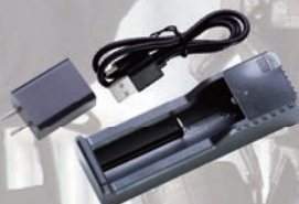
AC 充電器 型式：ACCH-18650-21700