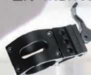
タクティカルマウント 型式：RGT9-TACM ライトをピカティニーレールへ取付可能