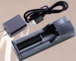
AC 充電器 型式：ACCH-18650-21700